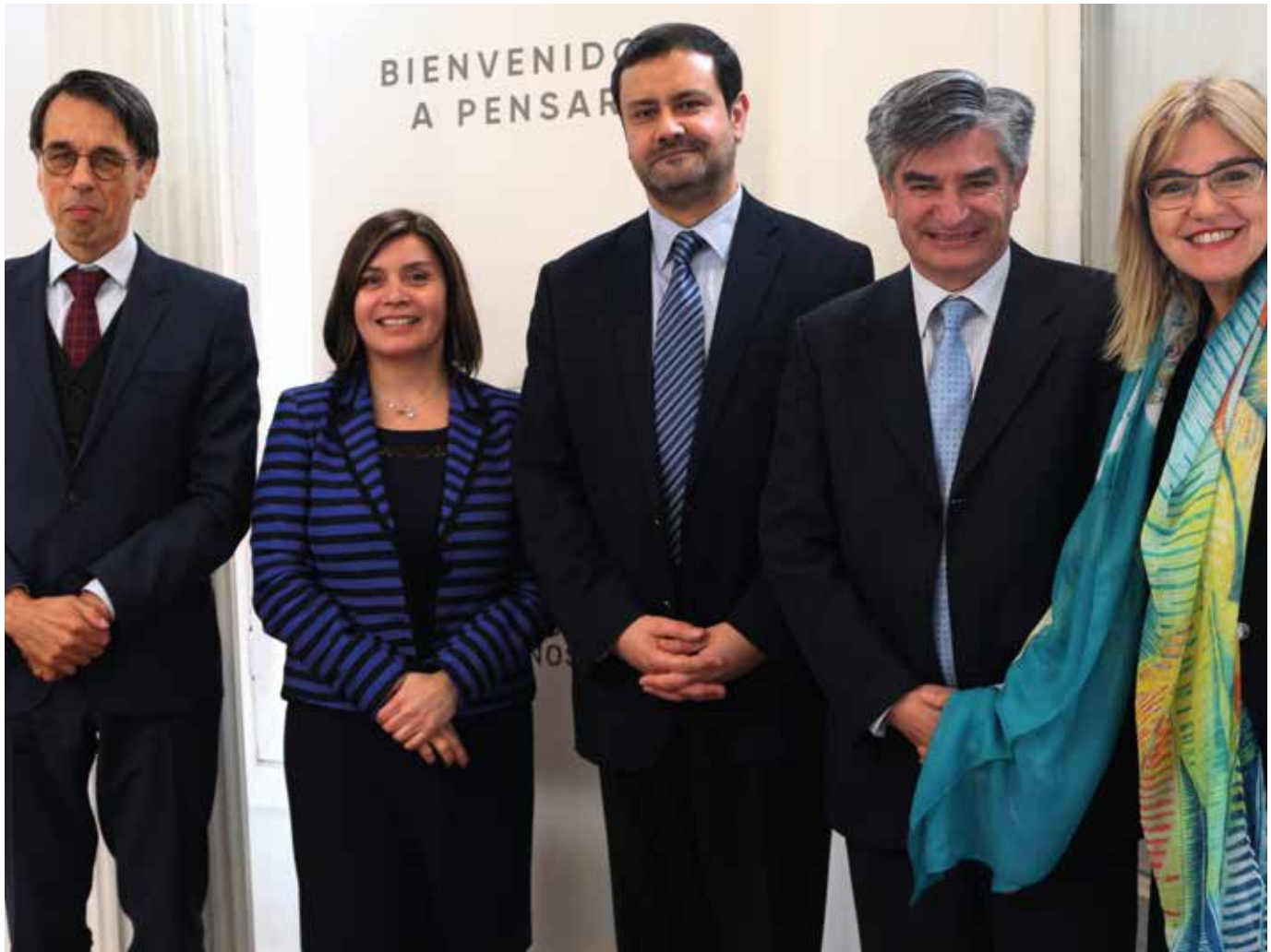
▲ Lanzamiento del libro “El Control de Convencionalidad: Un balance comparado a 10 años de Almonacid Arellano vs. Chile”.

→ Co-investigadora proyecto FONDECYT Regular N° 1161025: “Análisis diacrónico de los trabajos dogmáticos que formaron la Teoría Estándar de la Responsabilidad del Estado (1970-2015)”. Período: 2016-2019.