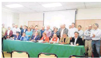
► Diferentes gremios se reunieron en Temuco.

Respecto de la querrela por incendio, la vocera del Ejecutivo, Paula Narváez, expresó