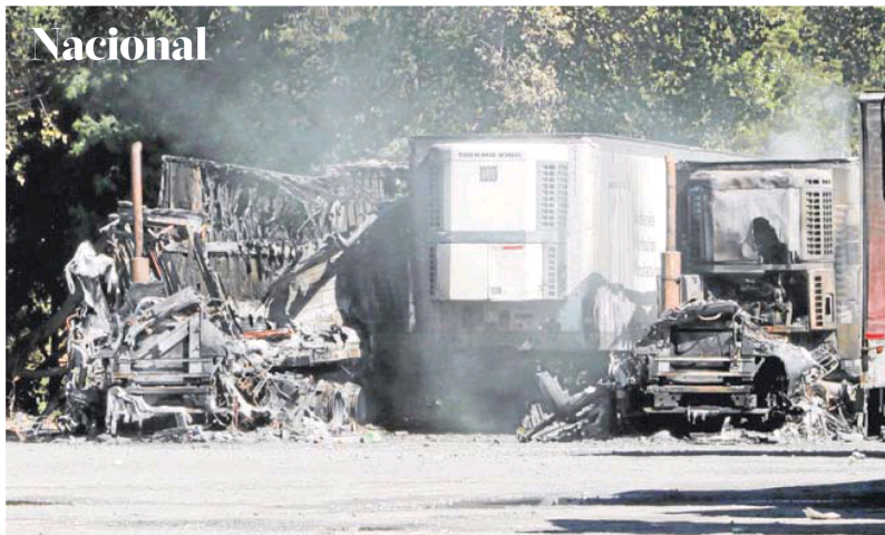
► Encapuchados quemaron 19 camiones la madrugada del domingo, en la IX Región.